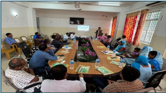
सप्तरीको खड्ग नगरपालिकामा आरआरटी र आरआरसी टोली गठन सम्पन्न भएको छ ।

प्रदेश स्वास्थ्य निर्देशनालयको आयोजना, स्वास्थ्य कार्यालयहरुको समन्वय तथा विश्व स्वास्थ्य संगठन को बित्तिय तथा प्राबिधिक सहयोगमा पलिकाहरुमा द्रुत प्रतिकार्य सम्बन्धि कार्यशाला गोष्ठी संचालन भएको छ। स्वास्थ्य आपतकालीन अवस्थाको पूर्वतयारी तथा प्रतिकार्यको लागि RRT, RRC गठन तथा अभिमुखीकरण अपरिहार्य रहेको छ।