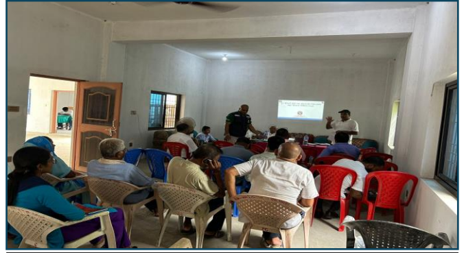
सिरहाको सुखीपुर नगरपालिकामा आरआरटी र आरआरसी टोली गठन सम्पन्न भएको छ ।