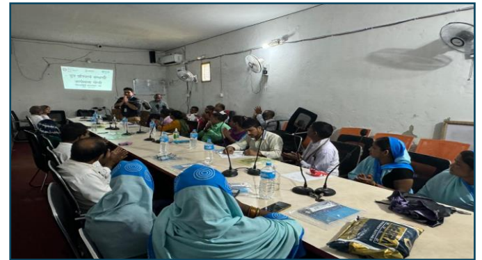
पर्साको बिन्दवासिनी गाउँपालिकामा आरआरटी र आरआरसी टोली गठन सम्पन्न भएको छ ।

नोट: सप्तरीको तिरहुत, खडक, शम्भुनाथ, रुपानी, अग्रिसाइर कृष्णसवरण, कञ्चनरुप र सप्तकोशी नगरपालिका