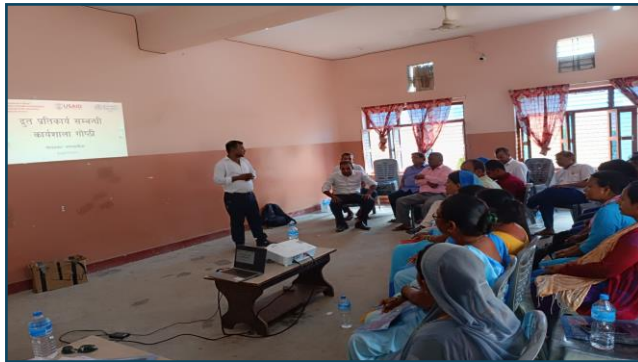
सिरहाको गोलबजार नगरपालिकामा आरआरटी र आरआरसी टोली गठन सम्पन्न भएको छ